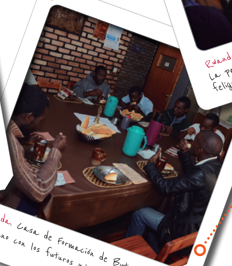
Rwanda. Casa de Formación de Butare. Desayuno con los futuros misioneros.