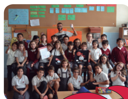
▲ Los alumnos de 4º de Primaria del Colegio Obispo Perelló de Madrid aportan su grano de arena para hacer realidad la granja de Yaoundé.