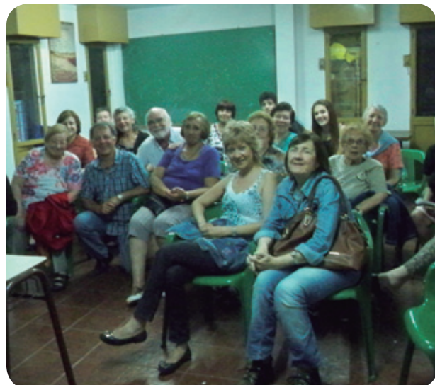
El grupo de mujeres de Villa Lugano hacen crecer la Procura. ▲