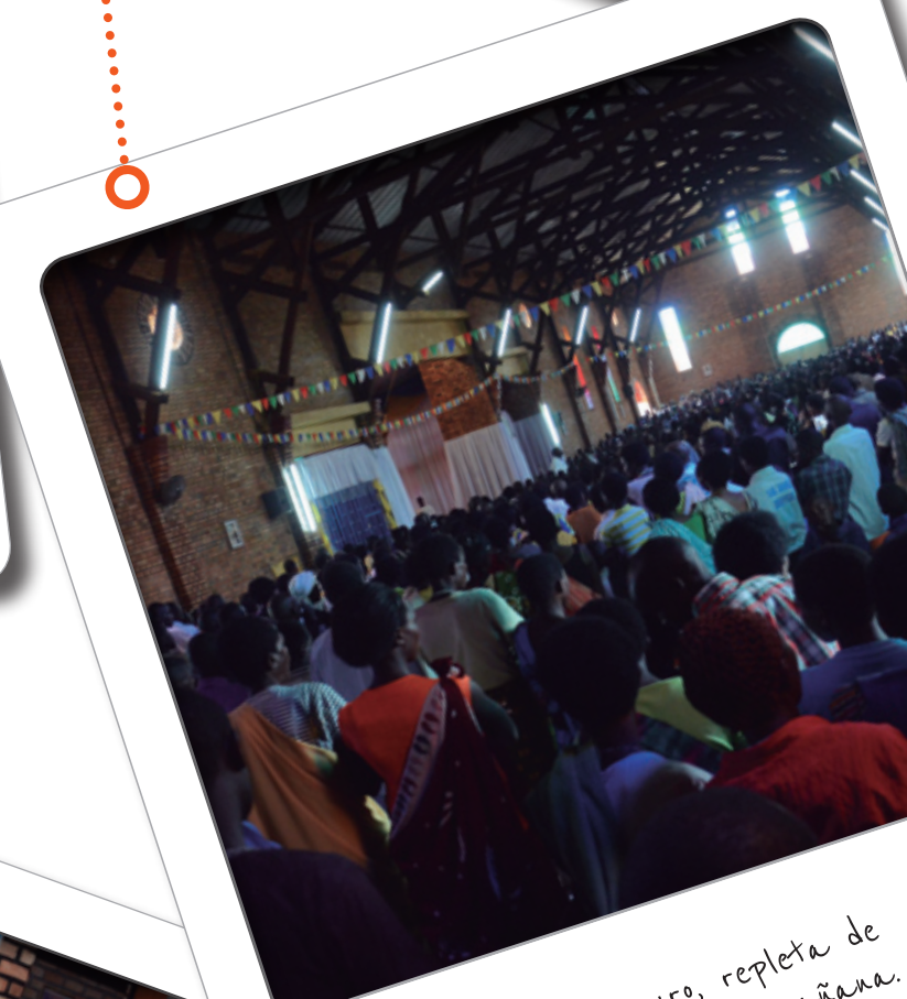
Rwanda. La parroquia de Kiziguro, repleta de feligreses un domingo por la mañana.