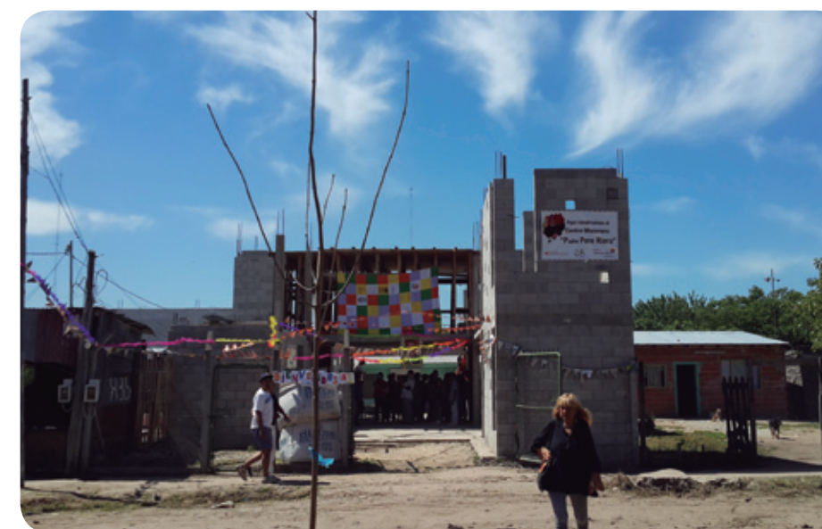
▲ Las obras siguen adelante; y desde lejos ya puede divisarse el edificio.