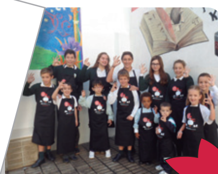
▲ Las aulas de infantil, primaria y secundaria del Colegio Arcángel San Rafael de les Germanes de la Caritat de Palma se han unido al reto.

Somos los alumnos de 3º de Primaria del Colegio Obispo Perelló de Madrid. Estamos intentando reunir los 25 euros para comprar la gallina con la mitad de lo que nos gastamos en el almuerzo en clase y vamos echando unas cuantas monedas cada día. Queríamos saber qué plazo tenemos para reunir el dinero y cómo podemos hacérselo llegar. Gracias.