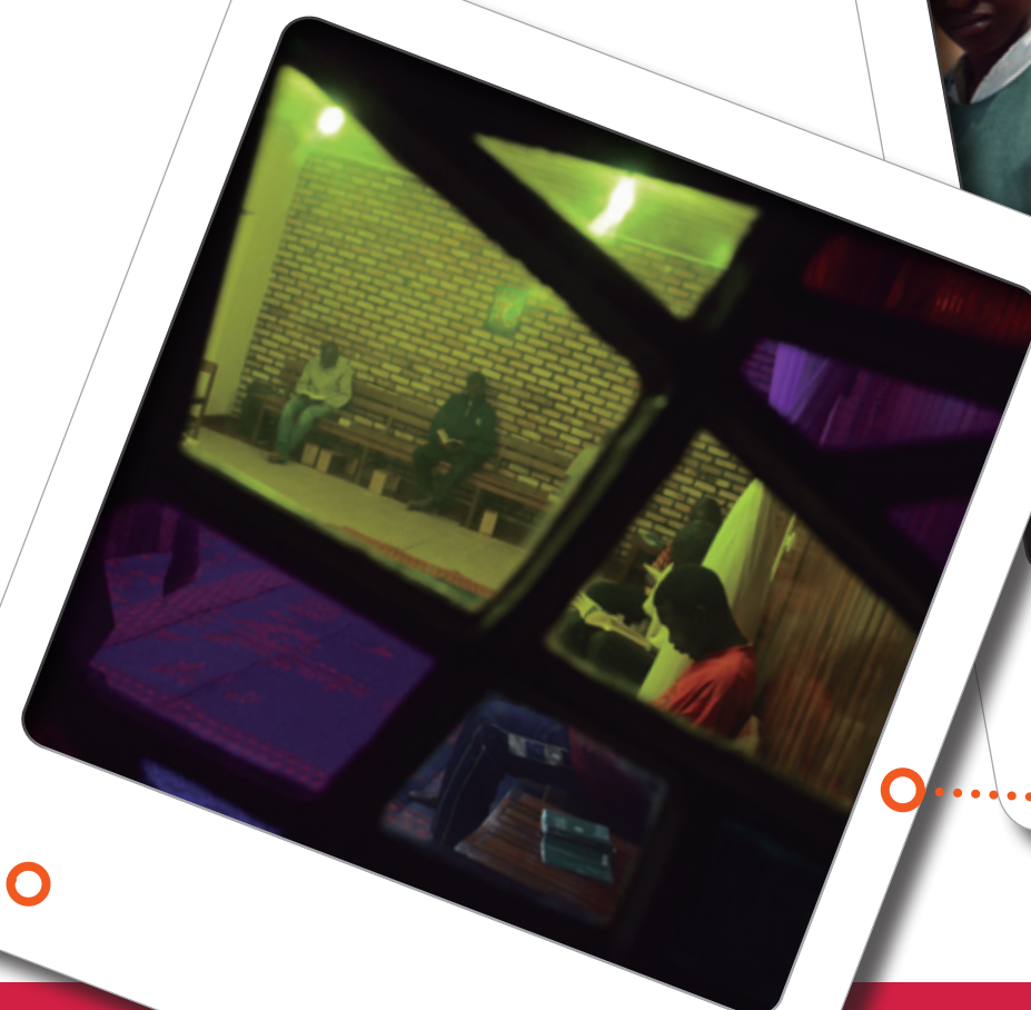
Rwanda. Casa de Formación de Butare. El día empieza para los novicios a las 5.30 de la mañana con la primera pregaría.