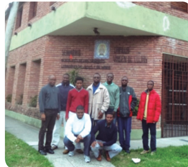
Los jóvenes estudiantes aprenden a estar al lado de los sencillos. ▲

Misiones Sagrados Corazones - Procura nació en 1967 para sostener el cometido de los Misioneros de los Sagrados Corazones en África. En la actualidad, su trabajo se centra en el apoyo a la formación de los futuros misioneros en África y América. También impulsa distintos proyectos sociales que hacen posible el trabajo al lado de los más necesitados.