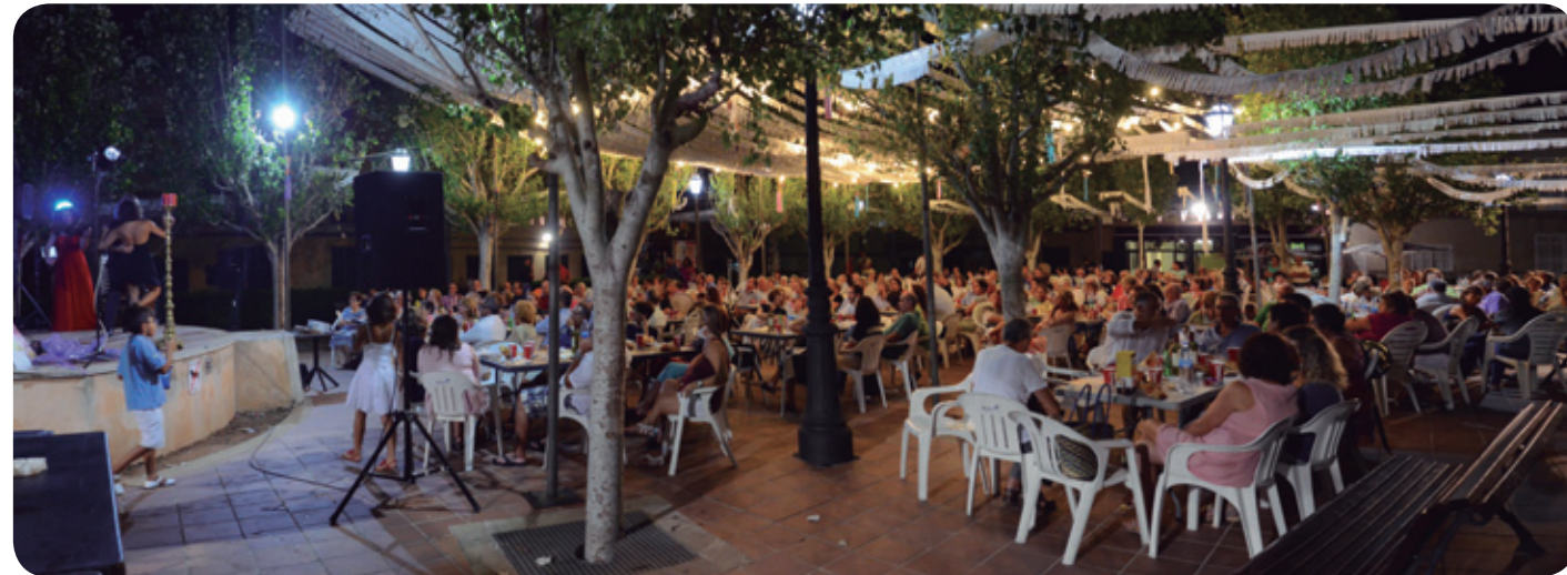
Cena Solidaria en Ariany ▲

Las iniciativas solidarias son actividades que promueven particulares, empresas, entidades o colectivos para conseguir recursos a beneficio de Misiones Sagrados Corazones. Cualquier iniciativa, por pequeña que sea, es una oportunidad para contribuir al trabajo de los misioneros. Aquí recogemos algunos ejemplos de las últimas acciones.