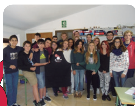
▲ Los alumnos de 3º de ESO del Col·legi Sagrats Cors de Sòller también se suman a "Una gallina, un futuro para todos".