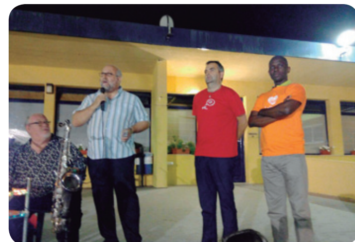
Cena de verano en Santa Eugènia ▲