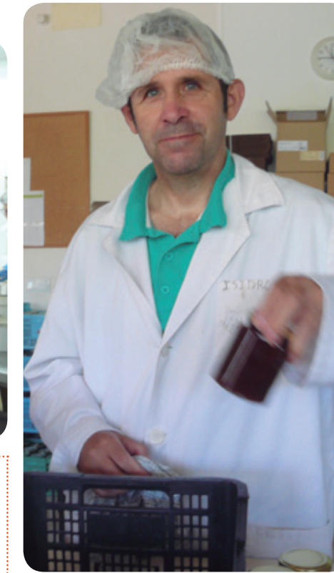
▲ Personas con discapacidad intelectual elaboran las preciadas confituras de Estel Nou.

Es sin duda una "empresa" diferente que nació en los ochenta con el objetivo de atender las necesidades de las personas con discapacidad intelectual y sus familias, y con el tiempo y el reconocimiento institucional ha pasado a ser un centro concertado dependiente de la comuni-